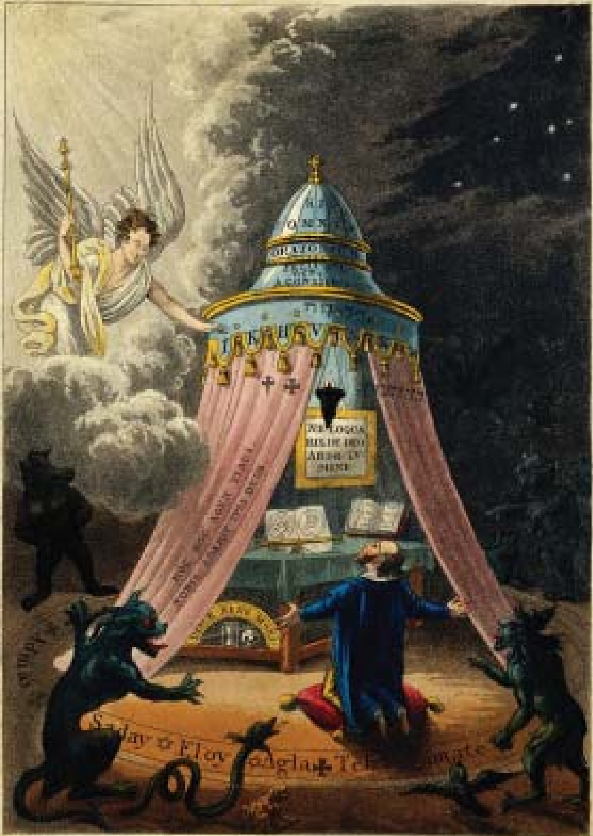
Such were the magic rites, ceremonies and incantations, used by the