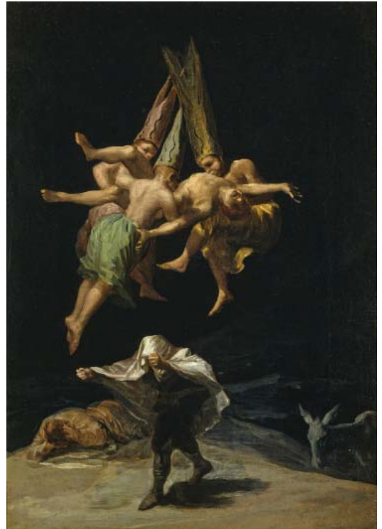
ÜLEVAL Kabalistlike märkide ja sigil'itega kaetud käe kujutis, 18. sajand. KÕRVAL Goya kõhedust ja rahutust tekitav maal lendavatest nõidadest on loodud siis, kui valgustusaeg andis 19. sajandi alguses teed tumedamatele teemadele.

Newton oli ka innukas alkeemik; alkeemiaga tegelesid paljud tema kaasaegsed. Üks neist, jesuiidi preester Athanasius Kircher, vaimustus poolmaagilistest automaatidest ja maagilistest ehitistest, nagu Saalomoni tempel. Palju hiljem sai ulmekirjanik Arthur C. Clarke kuulsaks tähelepanekuga, et iga piisavalt arenenud tehnoloogia on maagiast eristamatu. Kurikuulsa inglise okultisti Aleister Crowley jaoks oli maagia „iseenda ja oma olude mõistmise teadus”. Selline selgitus aitab okultismi mõista palju kaasaegsemal tasemel – see toob