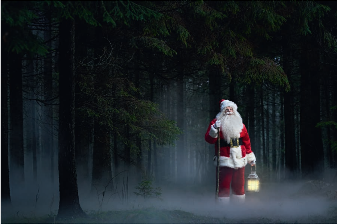
100 mm f/5,6 1/80 ISO 4000 Softbox 'iga välklamp, kuivjäa aur